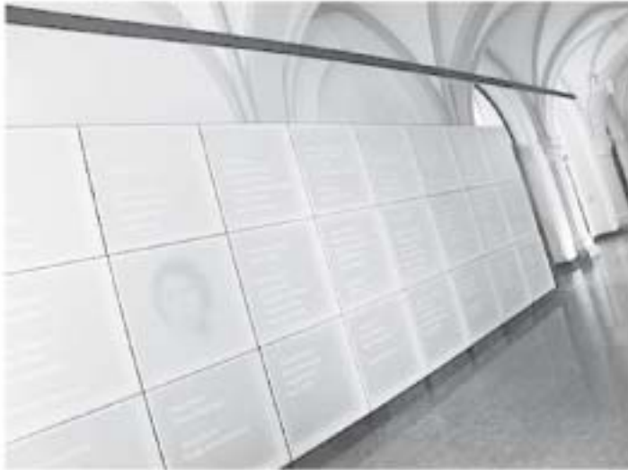
Erinnerungsstätte für verfolgte und ermordete Braunschweiger Sinti und Roma